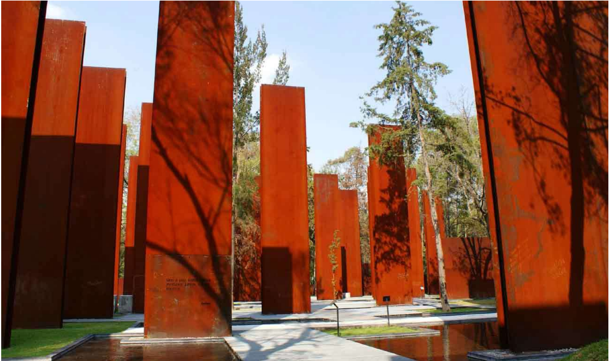
Referenční příklady ze zahraničí